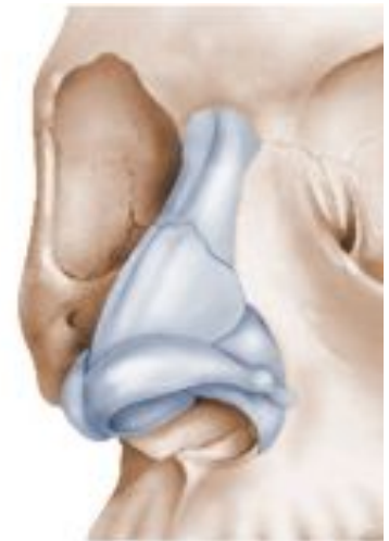
infrastructures ostéo-cartilagineuses du nez

Rectifications : L'infrastructure ostéo-cartilagineuse peut alors être refaçonée selon le programme établi. Cette étape fondamentale peut mettre en œuvre une infinité de procédés dont le choix se fera en fonction des anomalies à corriger et des préférences techniques du chirurgien. On pourra ainsi rétrécir un nez trop large, réaliser l'ablation d'une bosse, corriger une déviation, affiner une pointe, raccourcir un nez trop long, redresser un cloison. Parfois, des greffons cartilagineux ou osseux seront utilisés pour combler une dépression, soutenir une portion du nez ou améliorer la forme de la pointe.